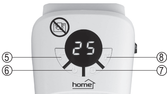
figure 2. • 2. ábra • 2. obraz • figura 2. • 2. skica • 2. obrázek • 2. slika