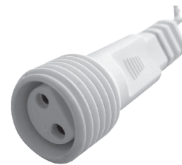
fig. 2. / 2. ábra / obraz 2. / Figura 2. / 2. skica / obraz 2.